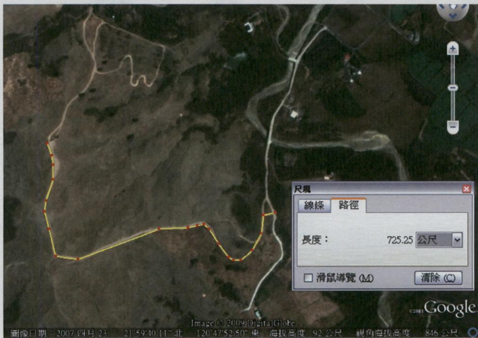
車輛指定行駛路線示意圖