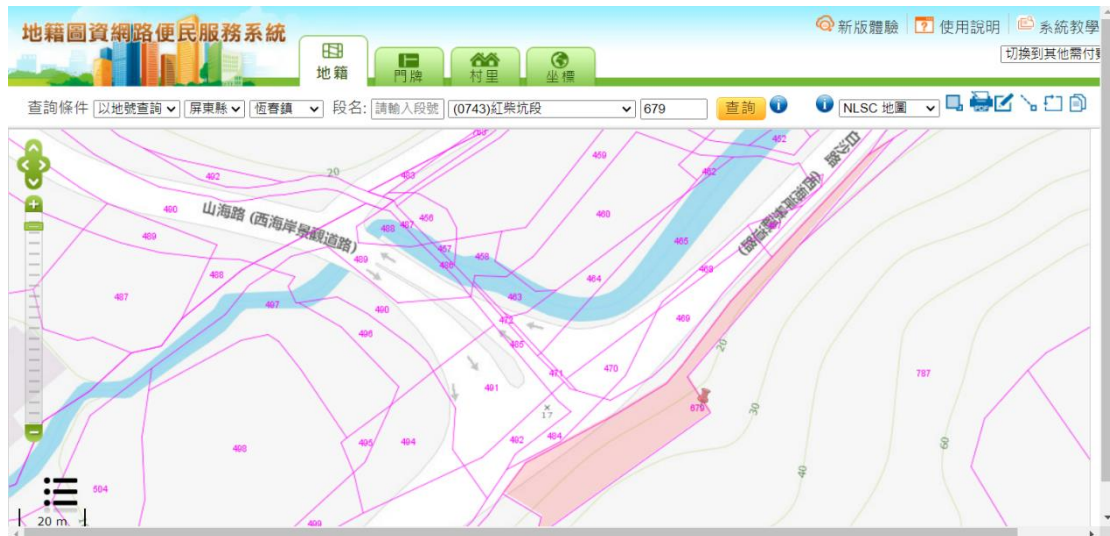
紅柴坑(白沙路、山海路口):屏東縣恆春鎮紅柴坑段 679 地號