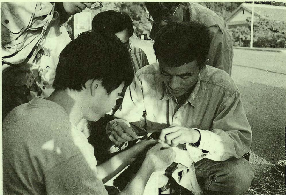
調查人員細心的解下台灣松雀鷹身上的鳥網。

增加，很顯然的，已經對渡冬的候鳥構成影響，尤其是經常需要上岸停棲的鳥種，所受到的干擾最為明顯。目前，在潭域周圍存在的牛羊隻放牧行為，極可能成為僅次於環境改變的第二大不利龍鑾潭區候鳥棲息的因素。