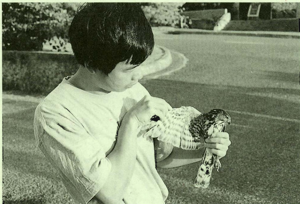
調查人員檢查台灣松雀鷹是否受傷。

是十二月十七日，與往年的調查日期相近。調查當日的天氣，是晴轉多雲偶小雨，午後東北季風約三級至四級。本年度共計有39位調查員參與調查，是調查人力較少的一年。