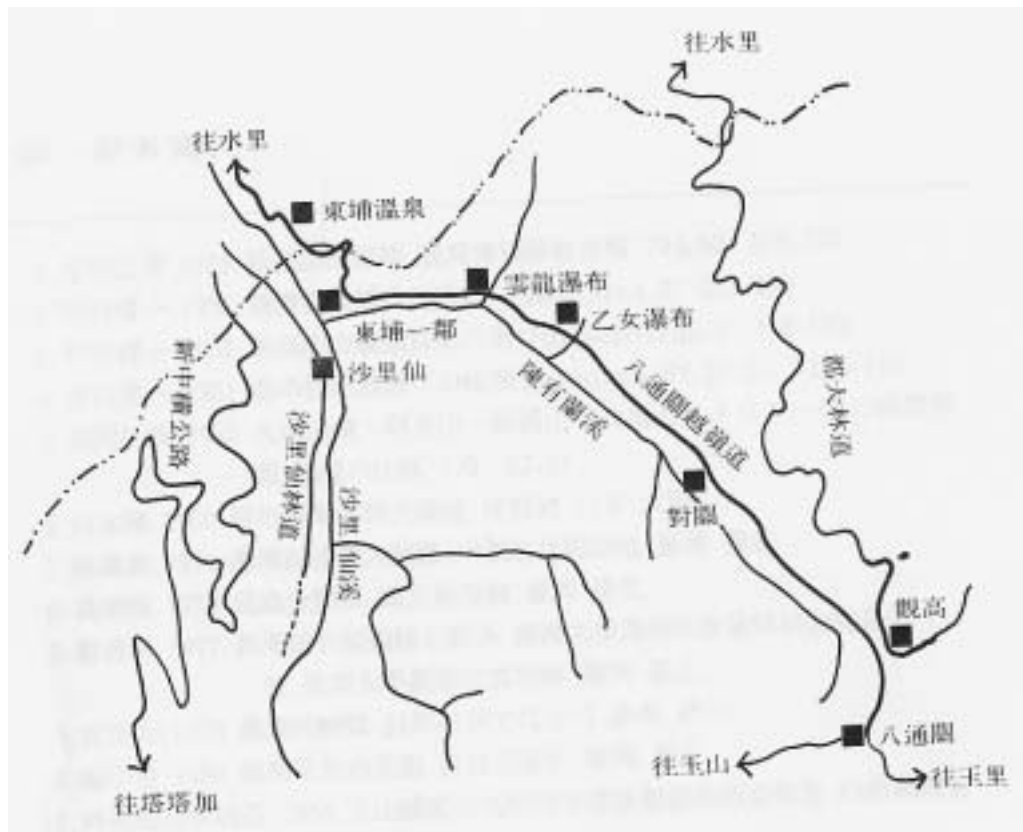
圖 1. 調查區詳細位置圖，紅色線表示本次調查所穿越之區域。各調查點海拔高度為：東埔村—1120M；雲龍瀑布—1650M；乙女瀑布—1730M；對關—2080M；觀高—2600M；八通關—2800M。