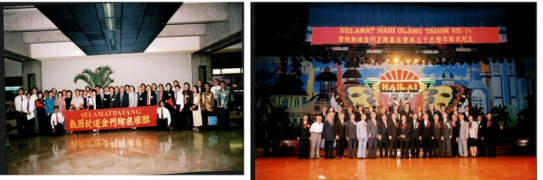
2001年新加坡金門會館團拜訪印尼金門互助基金會