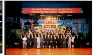
椰城金門互助基金會成立15週年聯歡會（2001年）