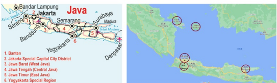
爪哇島的行政區劃

金門移民社群在爪哇島以雅加達、泗水、茂物等地為主。另外，有金門社群案例一開始在鄰近爪哇島的蘇門答臘巨港（Palembang）外的邦加島（Bangka）、勿里洞（Belitung）落腳，之後再遷至雅加達等地。