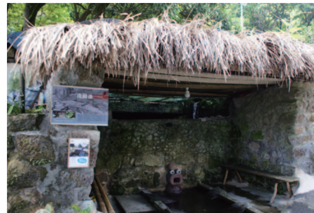
八煙的洗滌池是民眾重要的生活與情報交換中心，兼具功能性與交流性

八煙的人們是這裡最重要的活資產，他們保有純樸且善良的心，堅持守護自己的家園，而至今仍保有家不閉戶的農村生活，百年川流不息的水圳，訴說著前人的智慧與堅持。當地的阿公、阿嬤，舊時的兒時手工童玩，既環保、趣味、實用又令人回味。晚間「稻埕」點點繁星下，大人泡茶閒聊，小孩玩著「踢銅罐」躲迷藏、「123木頭人」的遊戲，「幸福的滋味」莫過於此。 10