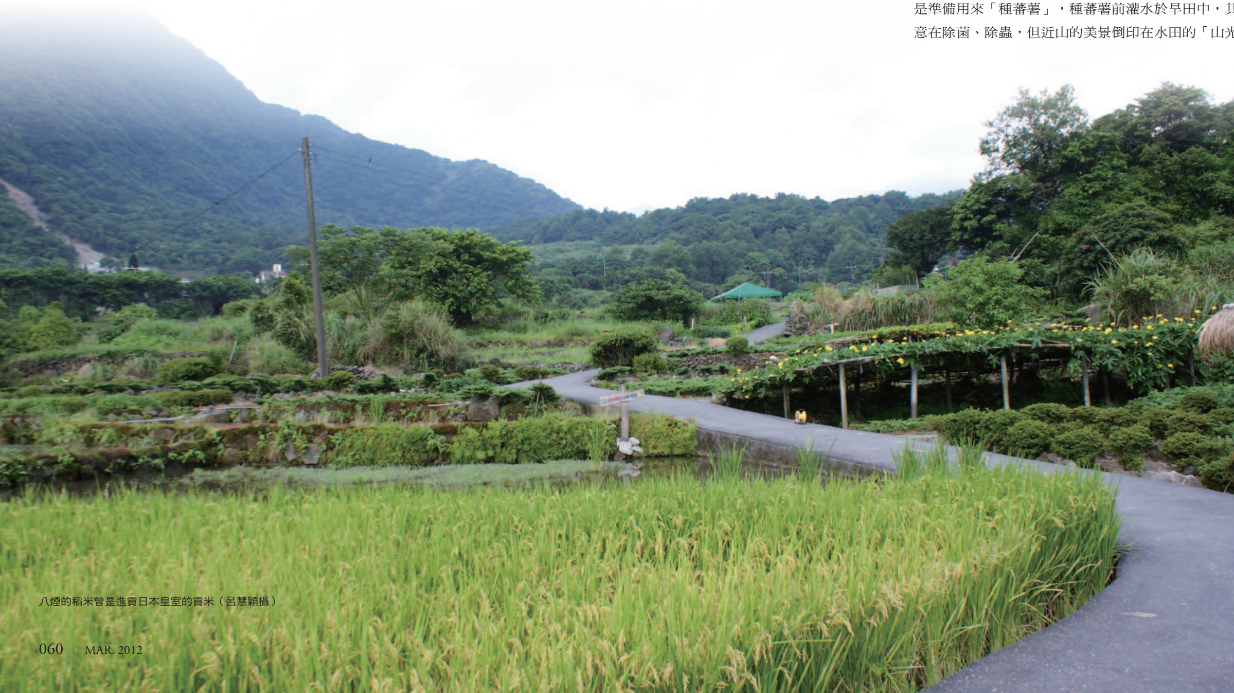
八煙的稻米曾是進貢日本皇室的貢米

陽管處與葉美秀教授團隊以「復舊如舊」的觀念為原則，藉由社區空間營造的專業與豐富經驗，邀請聚落耆老及居民一起依循百年舊法鋪造修復水圳溝體，讓如何運用在地材料，形塑當地砌石地景特色的傳統智慧，透過實做的過程中重新展現。只見耆老用節滿老繭的雙手，熟稔地敲打著石塊，經過選石、打