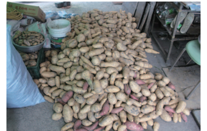
八煙出產的蕃薯