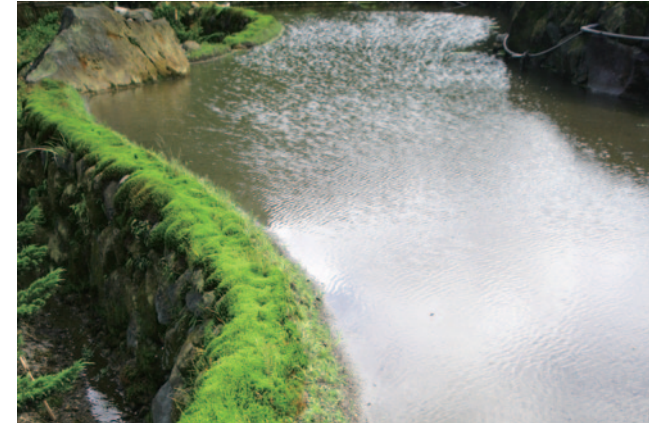
八煙水田景觀