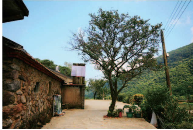
八煙舊名「三重橋」(生態工法基金會提供)