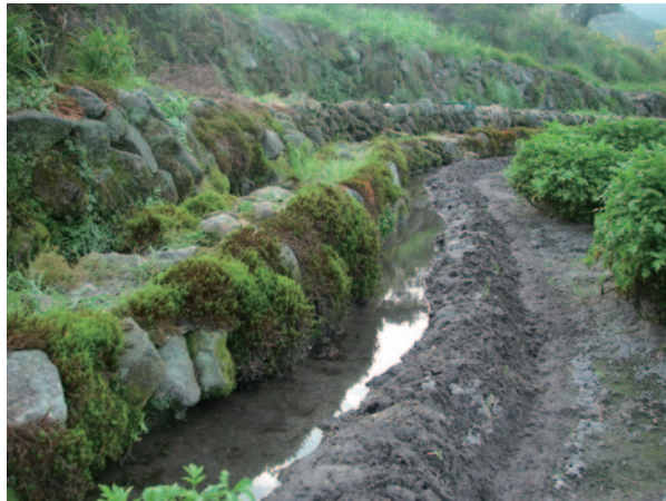
「石砌水圳」貫穿是八煙聚落的命脈