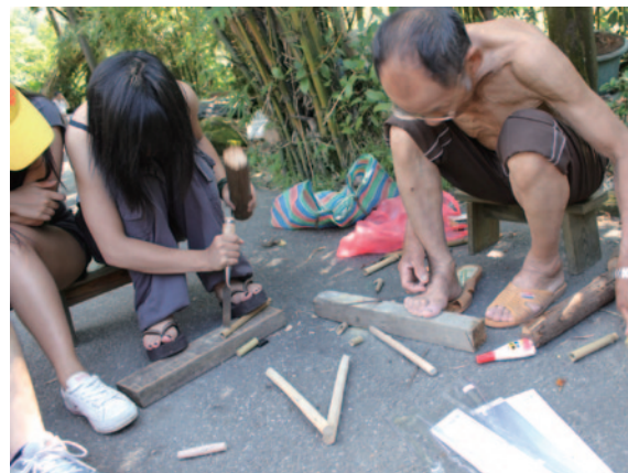
八煙的居民示範製作兒時童玩

這也是八煙在歷經審美觀念不停更迭後，仍能引人讚嘆之處，而歲月絲毫不會減損它的美，反而更添風雨淬鍊的風華。因此「中華民國自然與生態學會」與「行政院青輔會」共同舉辦「壯遊臺灣」系列活