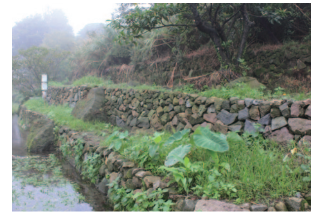
砌石工法是八煙的生態智慧，不但兼顧功能與生態性，更符合就地取材、在地使用的減碳原則。