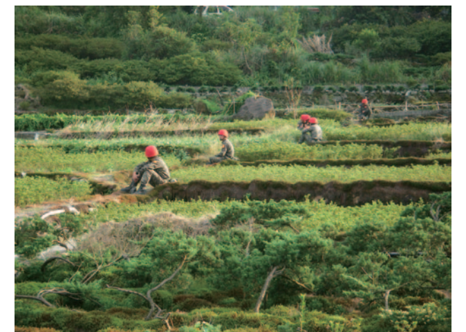
昔日的水田幾乎都沒有保留，改種少人工的高經濟作物