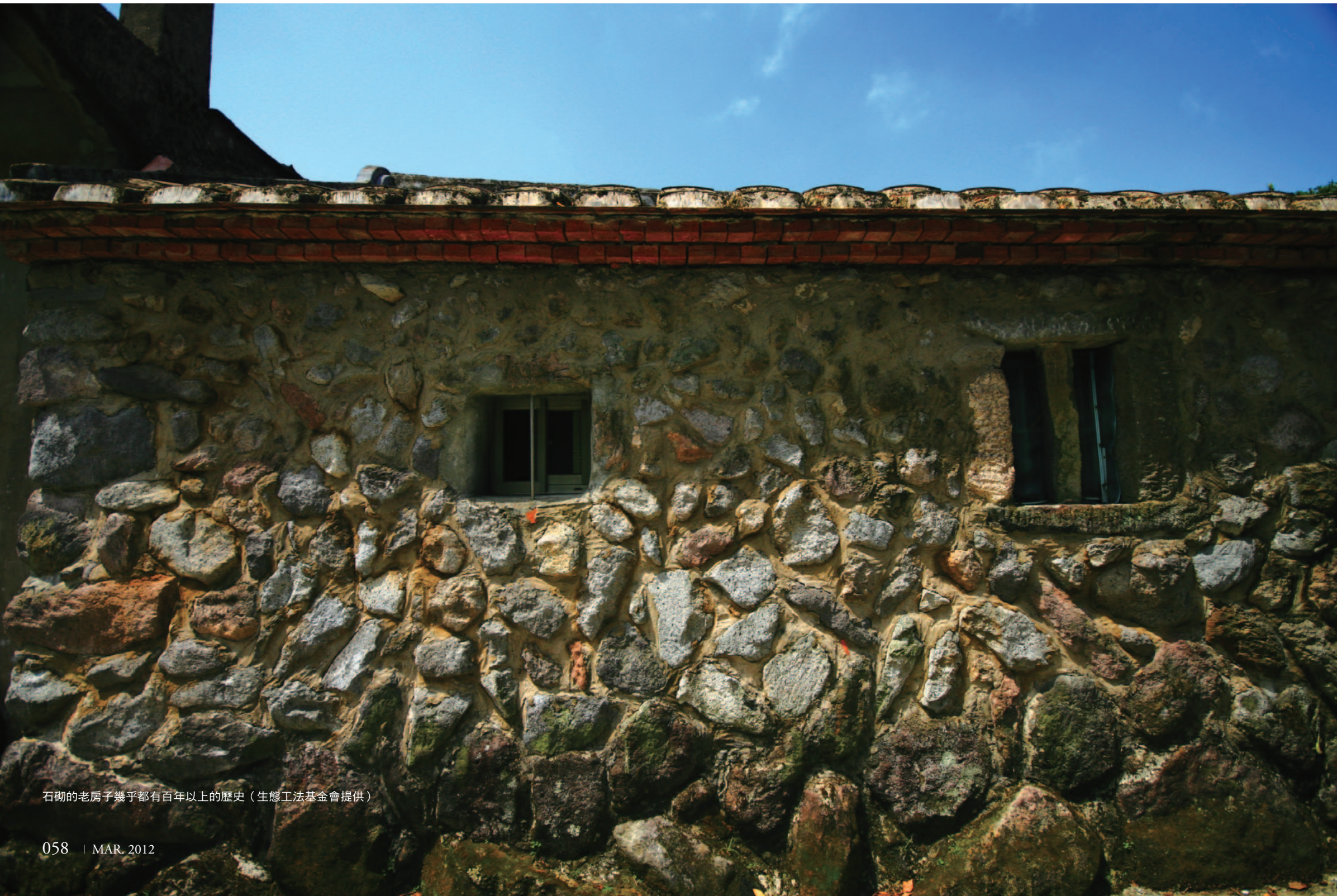
石砌的老房子幾乎都有百年以上的歷史(生態工法基金會提供)