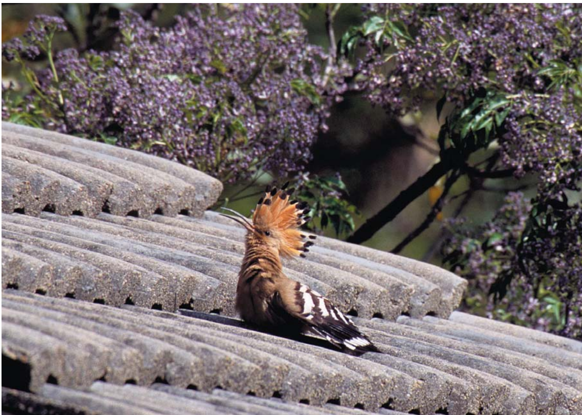
P.16右上圖 戴勝使用的墳墓旁有裸露在地上的地雷。

An exposed landmine beside a nest of Upupa epops near a tomb.