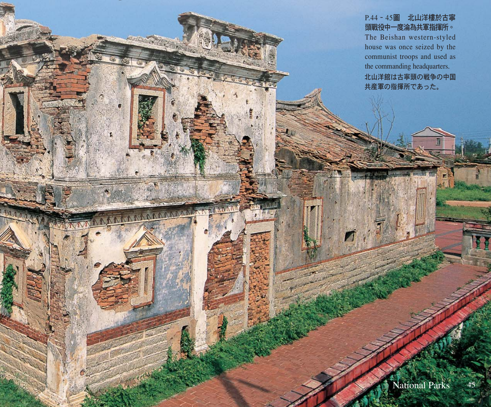
P.44 - 45圖 北山洋樓於古寧頭戰役中一度淪為共軍指揮所。 The Beishan western-styled house was once seized by the communist troops and used as the commanding headquarters. 北山洋館は古寧頭の戦争の中国共産軍の指揮所であった。

遠自晉朝，因五胡亂華、中原多故，當時即有多姓南徙金門避禍。靖康之變後，宋室南渡，泉州又有多姓豪門率族來金，築堤設堰、漁農倡興，金門又成為避難的樂土。明初洪武二十年（1387年），江夏侯周德興築城於今金門城，置千戶所，自此金門成為海疆防禦重鎮。特別是自明末以後，金門孤懸海角一隅，常常受到沿海盜寇的侵擾。內陸各個時期的內戰，讓金門受到戰禍接連、兵災不斷的牽累，戰爭雖不是直接發生於這座小島