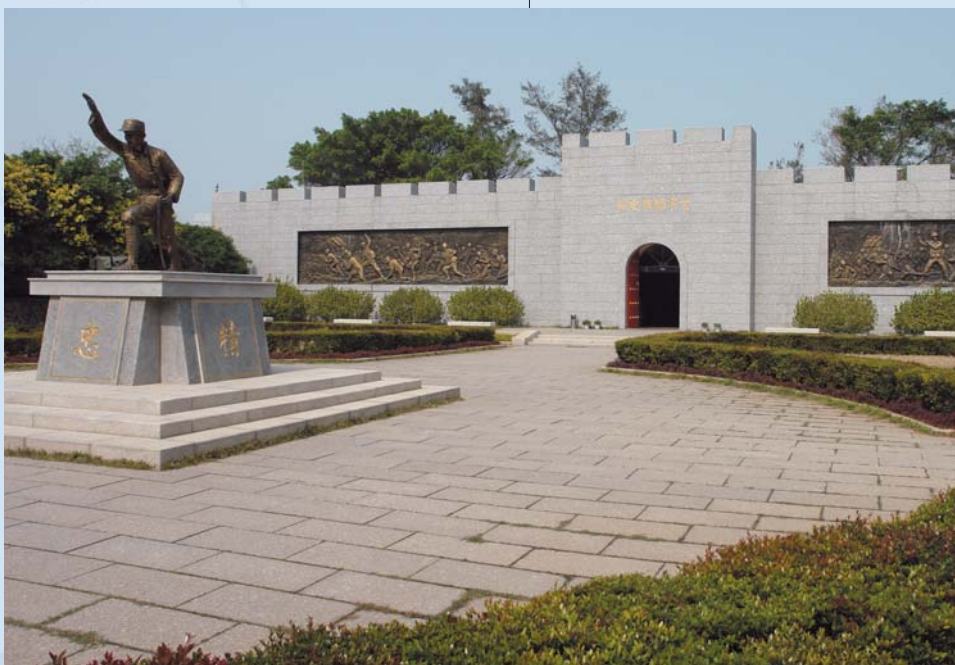
P.48圖 八二三戰役勝利紀念碑。 Aug. 23 Victory Memorial Stone. 八二三勝利紀念牌。

戰火中砲彈的無情摧擊、處處花崗岩下戰備工事的鑿磨刻痕，這樣的戰地金門，至今仍深嵌入在地人的生活中，也烙入世人的印象裡。戰地的悲愴已遠去，這島嶼往後不再寂寞，而能永恆地發出鏗然之聲，讓世界不得不向它行注目禮！