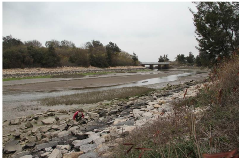
圖 4. 金沙溪口之棲地環境