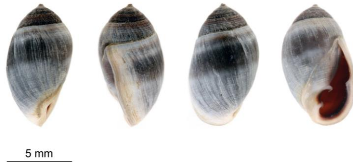
圖 1. 酒桶冠耳螺標本外型