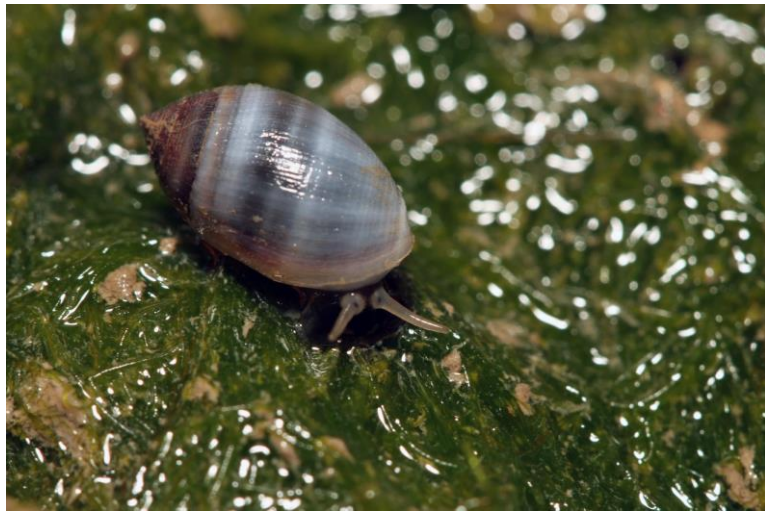
圖 3. 酒桶冠耳螺的生態照