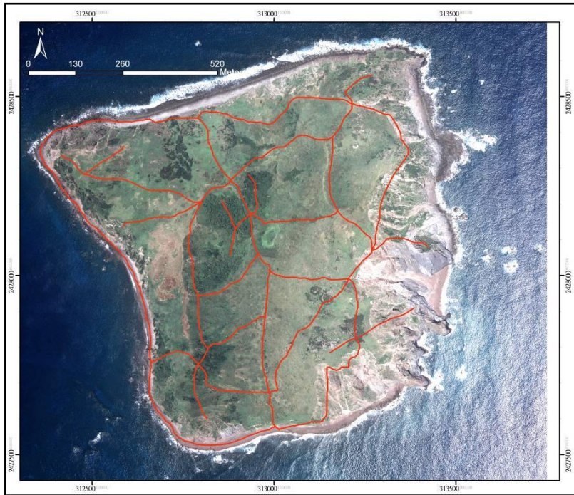
圖 1. 小蘭嶼植物調查路線圖